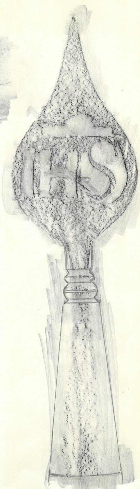
platt genom- skärning